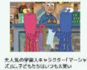
大人気の学園人キャラクター「マーシャーンズ」は、子どもたちにはいつも大受欢迎!

小学生入門コース ベーシックスピーキングI 60分×4日 英語圏の小学生が学校で最初に習う、英語の基本“フォニックス”を、セサミストリートの映像を使って楽しくマスター! 楽しいアクティビティは、スピーキングを自然と促す内容です。英語が初めての方や、少し経験はあるけどフォニックス*はまだという方は、この講座がお勧めです。