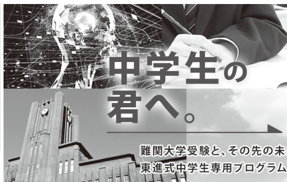
難関大学受験と、その先の未来を見据えた東進式中学生専用プログラム